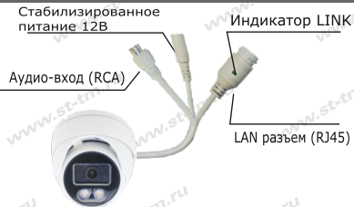
Рис. 1 Схема подключения видеокамеры